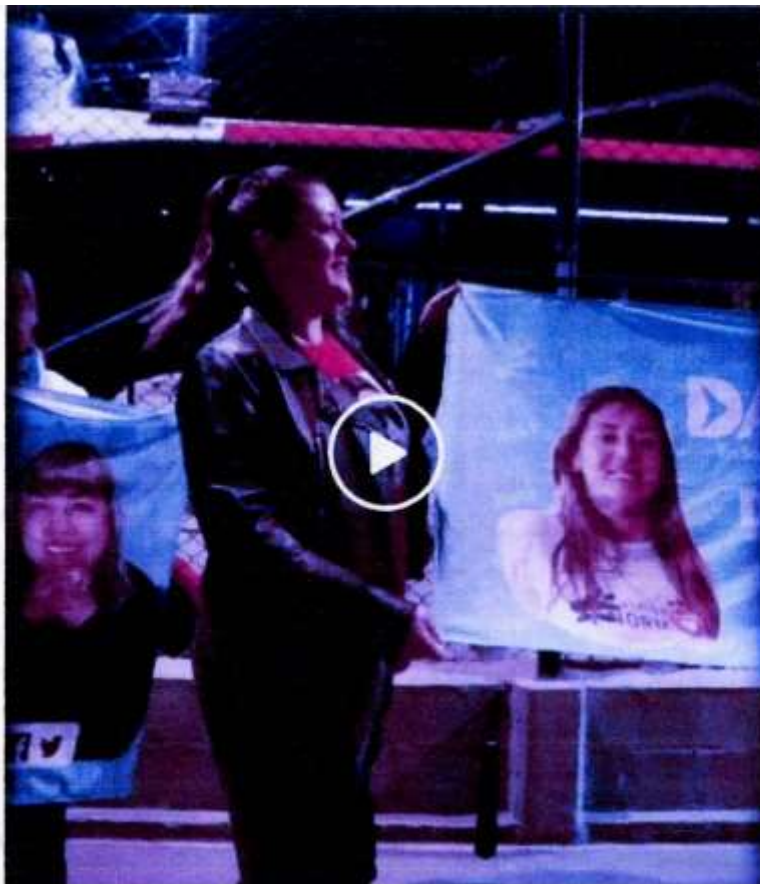
Reunión donde tiene pancartas impresa de publicidad